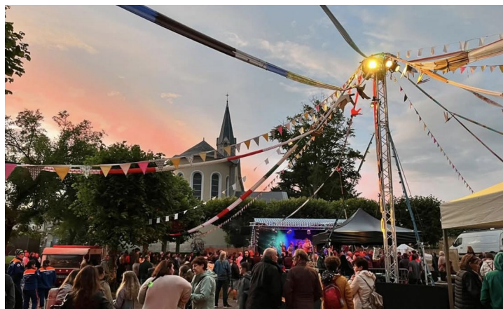
Le village du festival au Carré des Dames en 2024

Pour la troisième fois, c'est la compagnie de cirque associatif Boumkao qui s'est vue attribuer une « carte blanche » pour la mise en scène et la gestion de cet espace de rencontre à travers trois missions : gérer un espace de restauration et de buvette (food-trucks, cuisine végétarienne, bières locales...), animer l' espace de rencontre entre les publics et les artistes et proposer des concerts de clôture des trois soirées du festival afin de permettre au public de prolonger la fête après les derniers spectacles.