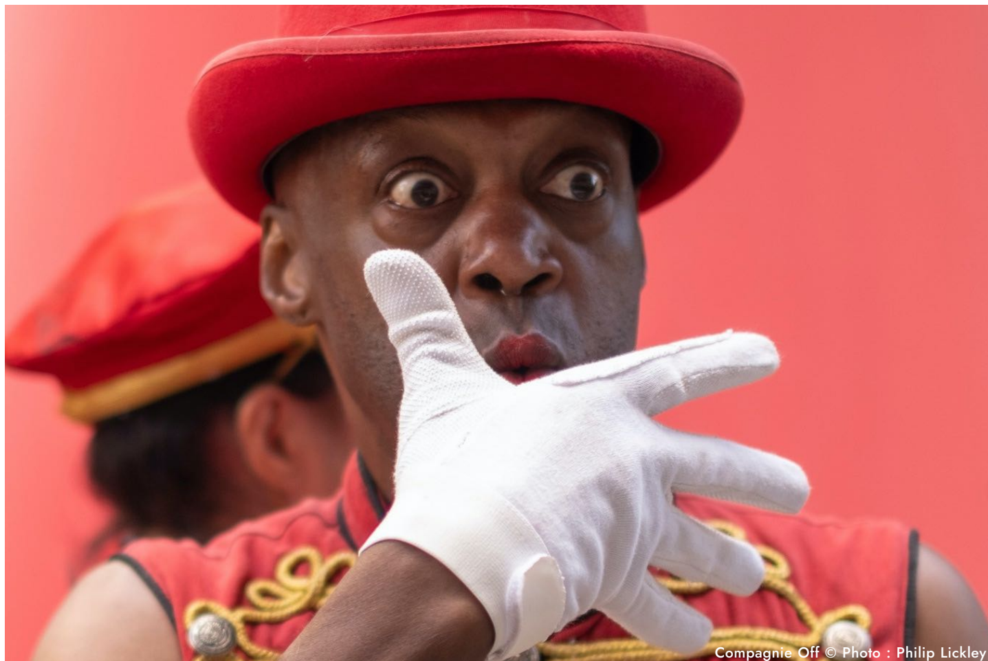
Compagnie Off

suivi par les Mardis spectacle et les Judis ciné plein air , continuité du festival dans les quartiers du Creusot | 17 juillet - 12 août 2025 | et par Les Folles Escales , festival de musiques du Monde | 22 - 23 août 2025 | dans le cadre de la 13 e saison culturelle estivale du Creusot Les Beaux Bagages