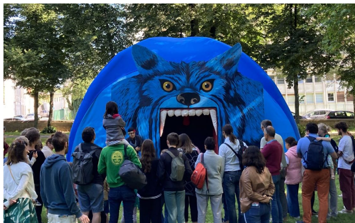
Au petit théâtre des ombres, Un sommeil de loup

En allant voir ce qu'il se passe dans le ventre du loup, une petite fille intrépide découvre ce que cet affamé a avalé : 3 petits cochons, 3 ours, 3 poules et 1 poisson ! Avec peu de paroles, cette histoire en ombres donne une jolie et joyeuse vision des histoires de loup .