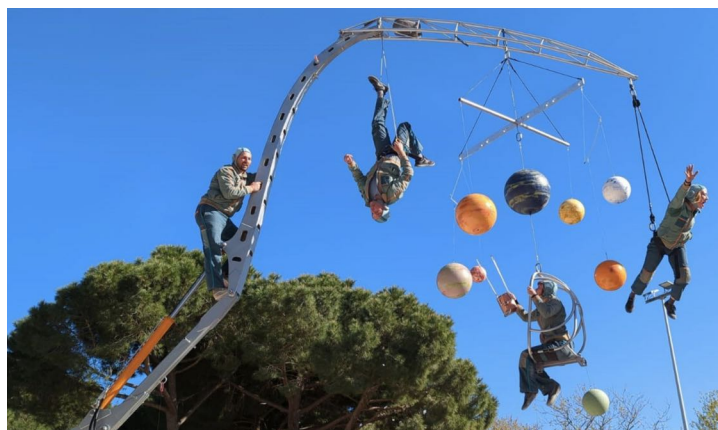
En corps En l'air & Les Sanglés, Gagarine Is Not Dead

Sur ses 4 pieds stabilisateurs, une pelle araignée de 2 tonnes est transformée en lanceur spatial pour propulser nos 4 cosmonautes autour de leur engin lunaire. Pourvu que les soudures tiennent ! Machinerie tournoyante, portés acrobatiques et aériens livrent une épopée vertigineuse où se dévoilent bon nombre de folies humaines. « De nos jours, on envoie n'importe quoi dans l'espace : des satellites, des milliardaires, des poubelles ! Alors pourquoi pas nous ? » — Création 2021