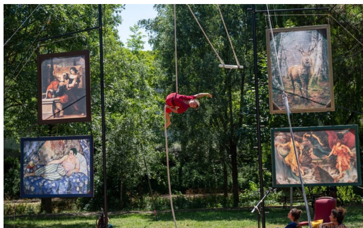
B-side Company, Les Oubliées

Au travers de témoignages intimes, les artistes de la B-side Company partent à la découverte de portraits de femmes oubliées. Dans l'élan d'un trapèze ballant, en rotation dans une roue, suspendues à une corde, ou en se mouvant dans un cerceau, en rap ou a cappella, elles voyagent dans le temps et dans l'histoire à la rencontre de reines, aventurières et autrices... Elles se soutiennent, se portent et se supportent pour rendre visibles des histoires de femmes , leurs histoires. — Création 2023