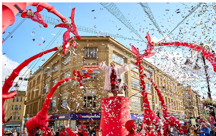
Compagnie Off, Les Girafes

Avec ce classique du spectacle en déambulation , Le Creusot est le cadre d'un ballet écarlate mené par un troupeau de girafes rouges. Glissant sur les avenues, leurs silhouettes longilignes se détachent avec nonchalance. Leurs têtes flirtent avec les étages autant qu'avec le public au sol. Manipulées, articulées, désarticulées et habitées par d'invisibles échassiers, elles se prêtent au jeu du domptage avec un directeur de cirque rêvant de leur faire traverser des cercles enflammés. De son côté, une superbe diva se lance dans un domptage lyrique, vocalisant pour rassembler les animaux qui l'adorent et parader avec eux au-dessus des rues. À terre, les garçons de piste tentent d'exciter les sens de leurs girafes autant que ceux du public. En un grand défilé clownesque, la clique s'emballe dans une tourmente radieuse à travers la ville. — Création 1999