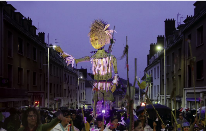
Les Rugissantes en 2023, déambulation dans les rues du Creusot de la marionnette géante Plume, Cie l'Homme debout