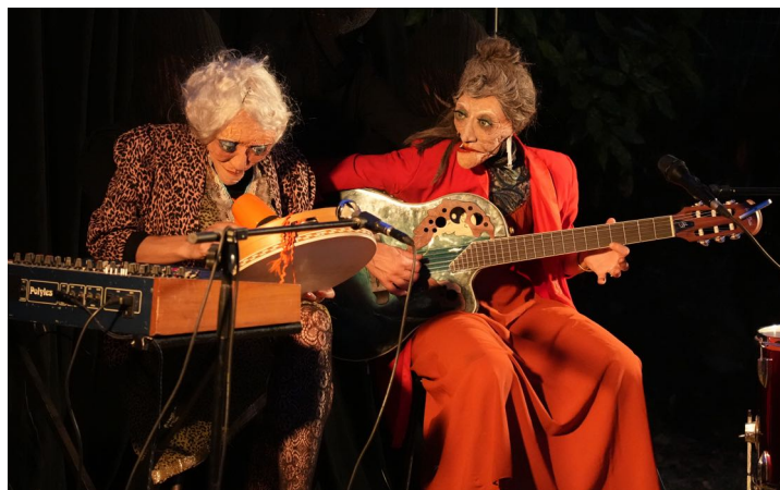
Rocking Chair Théâtre, L'art d'accommoder les restes

Sur scène, les deux vieilles dames offrent un tour de chant sensible et cocasse. Le temps d'un concert, elles exposent leur complicité, mêlée de traditions populaires de l'île italienne et d'une sagesse aussi drôle que piquante ! — Création 2022