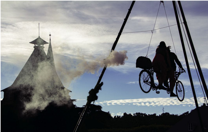
Les Rugissantes en 2024, spectacle de la Cie Leandre Clown dans la cour du château de la Verrerie