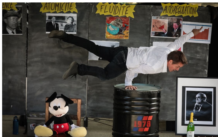
La Famille Goldini, 1978

« 1978, je suis né cette année-là, le 3 mars. Je suis acrobate. Dans ce spectacle, je parle de moi. En 1978, Milton Friedman impose ses idées, en Amérique et dans le monde entier. Ses idées ont beaucoup influé sur ma vie. Dans ce spectacle, je parle beaucoup d'économie. En 1978, c'est la crise. Une crise qui dure depuis 1973, le premier choc pétrolier. L'année suivante, en 1979, c'est aussi la crise, deuxième choc pétrolier. Et les années suivantes, il y a aussi des crises... beaucoup. D'ailleurs aujourd'hui, c'est toujours la crise. »