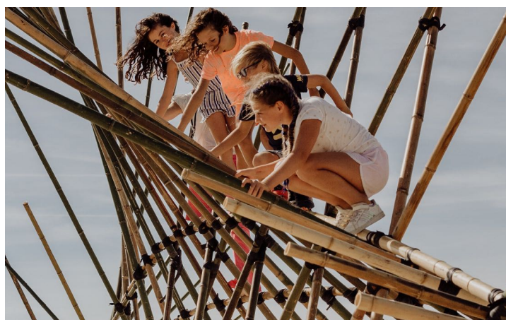
Cie Moso, Morphosis

Adultes et enfants sont invités à découvrir la maquette, les matériaux, le savoir-faire et l'architecture de l'objet. Au bout d'une heure, la structure est assez formée pour être grimpée et explorée. Les constructeur-trices la font grandir et évoluer tout en invitant les publics soit à participer à la construction (adultes et à partir de 11 ans), soit à explorer-grimper l'œuvre (dès 2 ans)... Chacun-e trouve alors sa place, qu'il-elle soit observateur-trice, constructeur-trice ou grimpeur-se.