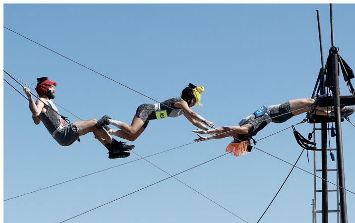
Marcel et ses Drôles de Femmes, Masacrade

Masacrade tourne les pages délicieuses de celle qui frappe, qu'on redoute ou qu'on aimerait choisir, qu'on affronte avec panache ou sur laquelle on tombe bêtement et qui nous rattrapera inéluctablement... la mort. Au cours de cette funeste cérémonie, nos protagonistes, guidés par une voix off, vont questionner celle sans qui le trépas n'aurait de substance... la vie. — Création 2023