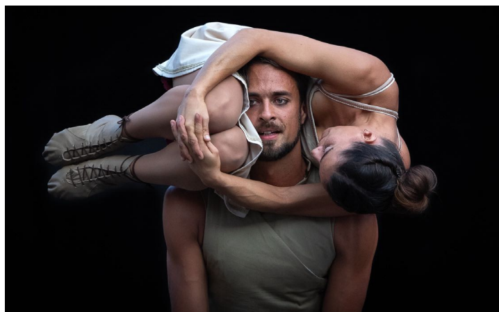
Duo Kaos, Time to Loop

Time to Loop a remporté de nombreux Prix et a été distingué en 2018 au festival Poetic Invasion of the Cities, dans le cadre du prestigieux Sibiu International Theatre Festival en Roumanie. – Création 2015