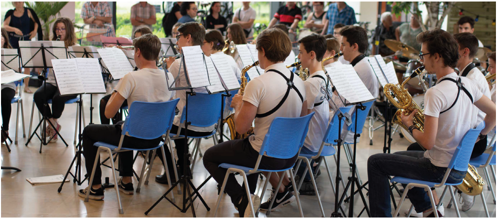
Concert Orchestre Junior - Centre commercial Leclerc Montceau

Le but est de mettre les élèves au maximum en situation d'artiste interprète. Les professeurs interviennent au sein des écoles de la ville pour présenter les différentes familles d'instruments. Les élèves proposent également des animations lors de vernissages d'expositions.