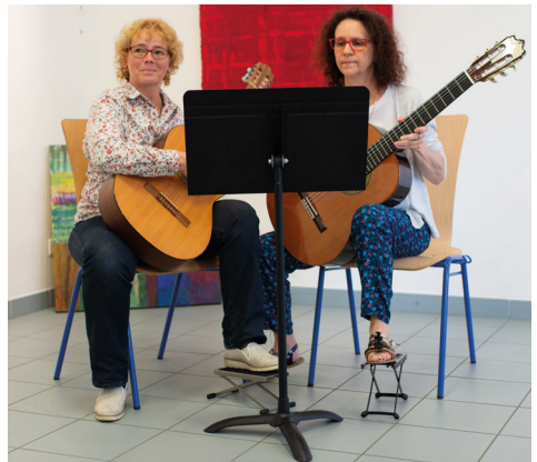
Concert classe de guitares - Vernissage d'exposition