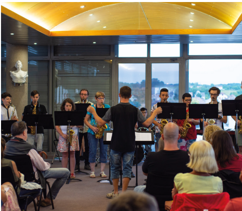
Les Saxos «sur le toit» - Salle du Conseil municipal de la Mairie