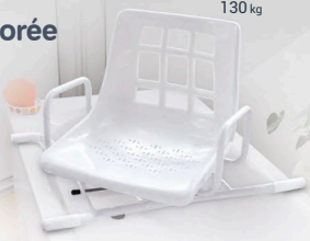
Planche de bain